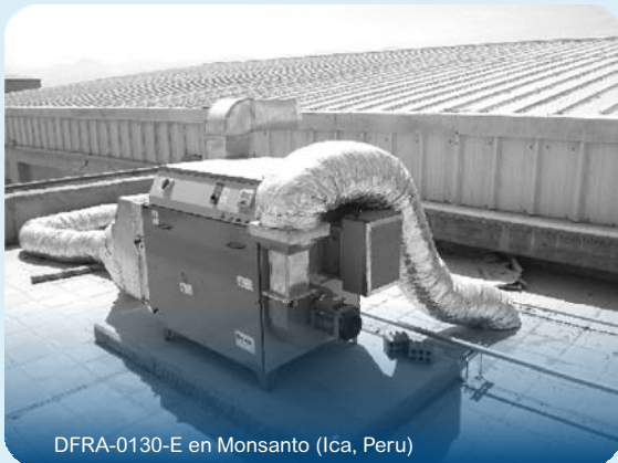
DFRA-0130-E en Monsanto (Ica, Peru)

La serie DFRA es óptima para grandes salas o donde la apertura de puertas sea más frecuente. Estos equipos son capaces de llegar a condiciones de aire muy secas y trabajan muy bien en cámaras de conservación en positivo. Fisair ha trabajado con multinacionales de renombre con estos equipos.