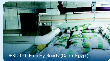
DFRD-045-E en Hy-Seeds (Cairo, Egypt)

La serie DFRD es óptima para pequeñas estancias donde la apertura de puertas a la estancia sea muy reducida. Fisair ha trabajado con grandes empresas con estos productos.